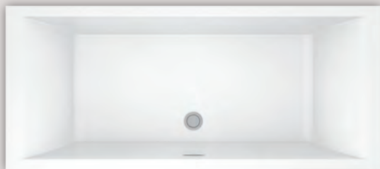
NOKORI 7131 (AUTOPORTANT)